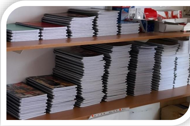
Conjunto de caderno